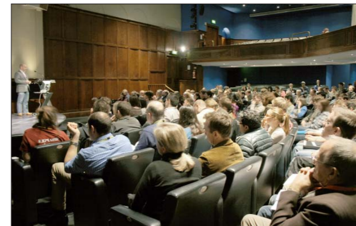
UTFORSKARKONFERANSE: Explore 2011 gjekk føre seg i London, og godt over 100 deltakarar fekk høyra om mange eksotiske ekspedisjonar, deriblant til ein norsk bre.