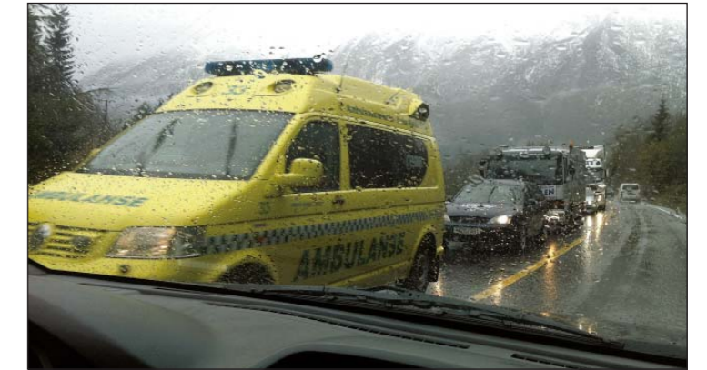
TIL OPERASJON: Ein sjukepleiar varsla om det vedkomande meinte var ein uforsvarleg transport av eldre pasientar.

LEIKANGER: Helse-tilsynet i Sogn og Fjordane meiner at Helse Førde HF ikkje braut forsvarlegkravet i høve behandlinga av tre ortopediske pasientar.